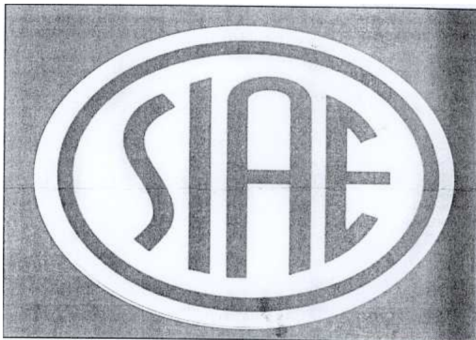
il logo ufficiale della Società Italiana degli Autori e degli Editori

Il lavoro da fare non è poco. Innanzitutto la Siae deve affrancarsi dalla fama di ente di riscossione, recuperando e valorizzando il suo ruolo di luogo di incontro e di dialo-